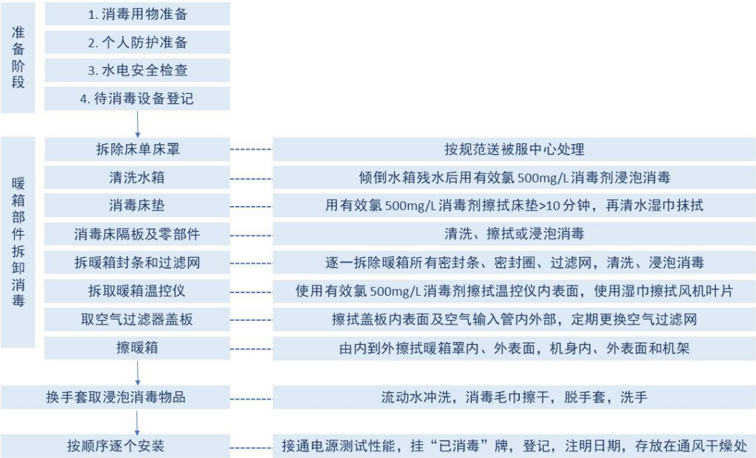
图 A. 2 终末消毒流程